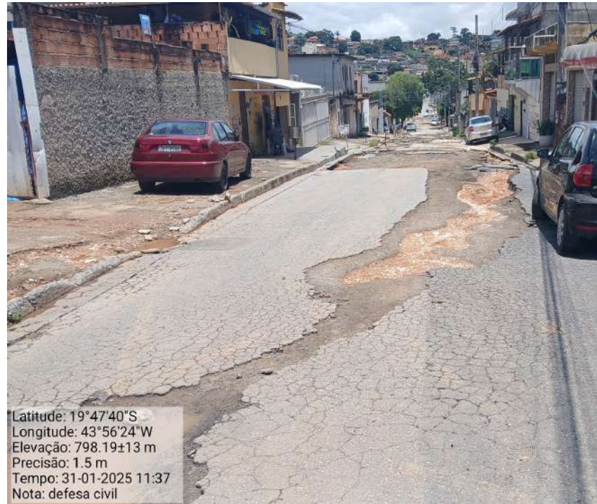
Latitude: 19°47'40"S Longitude: 43°56'24"W Elevação: 798.19±13 m Precisão: 1.5 m Tempo: 31-01-2025 11:37 Nota: defesa civil