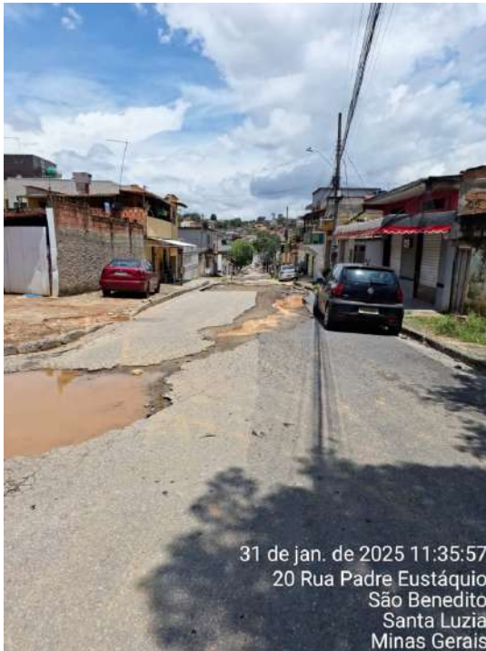
31 de jan. de 2025 11:35:57 20 Rua Padre Eustáquio São Benedito Santa Luzia Minas Gerais

EXECUÇÃO DE REDE DE DRENAGEM / PAVIMENTAÇÃO.